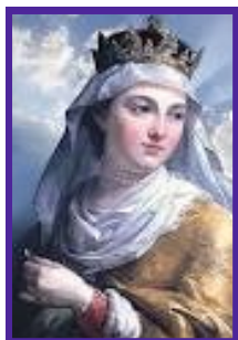
ŚW. JADWIGA KRÓLOWA

Publiczne Gimnazjum im. Św. Królowej Jadwigi