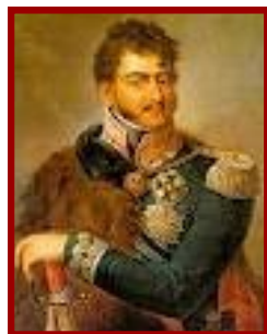
KS. JÓZEF PONIATOWSKI

Publiczna Szkoła Podstawowa im. ks. Józefa Poniatowskiego